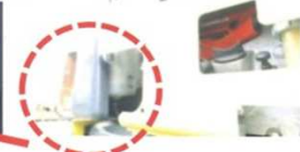
②エンジンオイル検油部