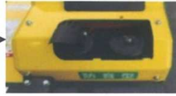
エアクリーナカバーを外した状態。